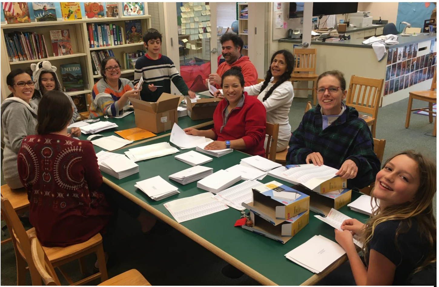
Parent and student volunteers assist with the preparation of mailers for Nicasio School Foundation's Annual Giving Campaign, which is now underway! All families are encouraged to contribute what they can!