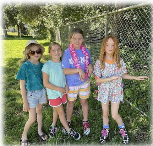
Beach Day May 10, 2024