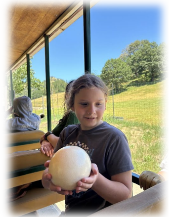
Field trip to Safari West May 13, 2024