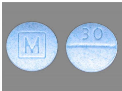
Percocet falsificado que contiene Fentanyl

Fentanyl es de 80 a 100 veces más potente que la morfina y de 40 a 50 veces más potente que la heroína.